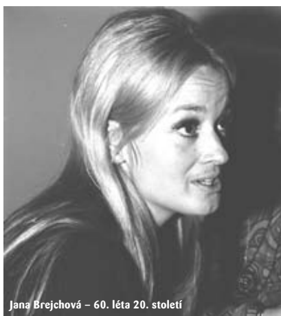
Jana Brejchová – 60. léta 20. století

Následující historie pak už skoro není historií, ale současností. Po Ivanu Šmídovi se stává ředitelem Finále Ivan Jáchim a festival vede až do současné doby. Hrané filmy přihlašují producenti a od loňska je hodnotí mezinárodní porota. Od loňska soutěží i filmy dokumentární, které jsou rozděleny do dvou kategorií: do 30 a nad 30 minut. Těch je naopak tolik, že je před vlastním festivalem musí prosívat odborná komise. Porota je oproti dřívějšímu mezinárodní. Jen ledňáček ještě zůstal, i když má už jinou podobu.