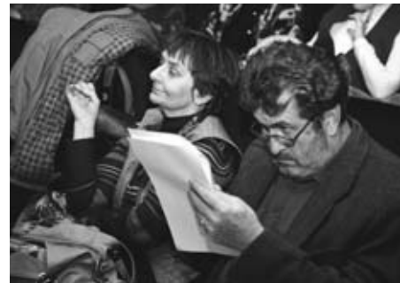
Zástupci sedmé velmoci