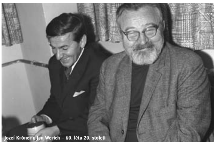
Jozef Króner a Jan Werich – 60. léta 20. století