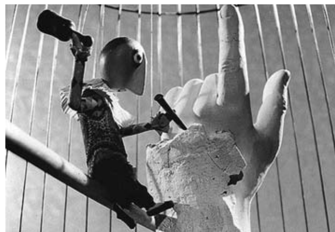
Scéna z filmu Ruka

Galerie Millennium v Praze v ulici Tržiště otevřela výstavu Svět Jiřího Trnky a jeho přátel. K vidění bude do 11. března.