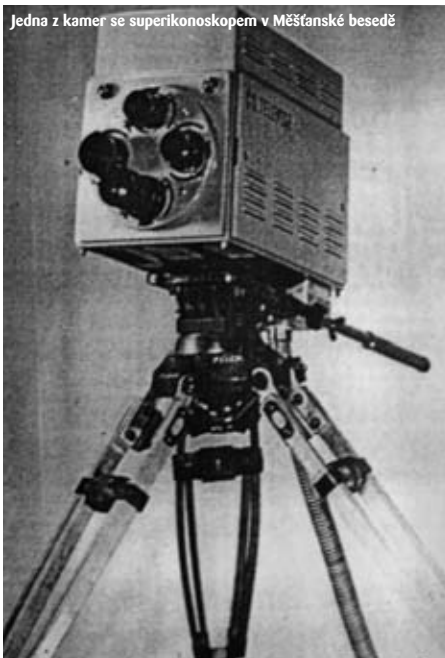
Jedna z kamer se superikonoskopem v Měšťanské besedě

Nejvzrušivějším okamžikem pro mne byla práce na poválečné kapitole, kdy televize vznikala pod kuratelou Vojenského technického ústavu v Tanvaldu, protože jsem některé dokumenty ve Vojenském ústředním archivu držel v rukou jako první civilista vůbec. Takže jsem rád, že v knížce je spousta zcela nových skutečností. Díky tomu má snad smysl.