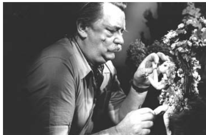
Jiří Trnka s loutkou Puka při natáčení snímku Sen noci svatojanské (1959)

Jeho mecenáši a obdivovatelé mu pomáhali celá léta. Nabízeli mu emigraci, zařízené studio, byt, profesuru i klid na práci v klášteře.