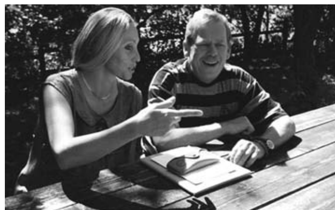
Při natáčení dokumentu

Počtvrté jsem s prezidentem Václavem Havlem v roce 2010, přesně rok před jeho odchodem na věčnost, natáčela rozhovor mezi ním a Věrou Čáslavskou do životopisného filmu o slavném gymnastce. Věra byla po re-