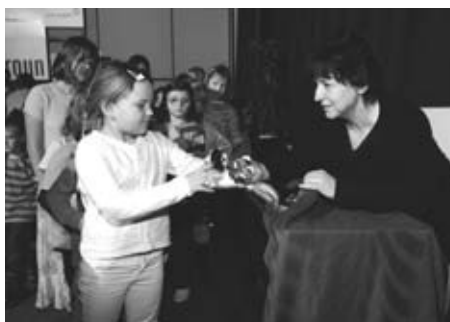
Děti neodcházelý s prázdnou