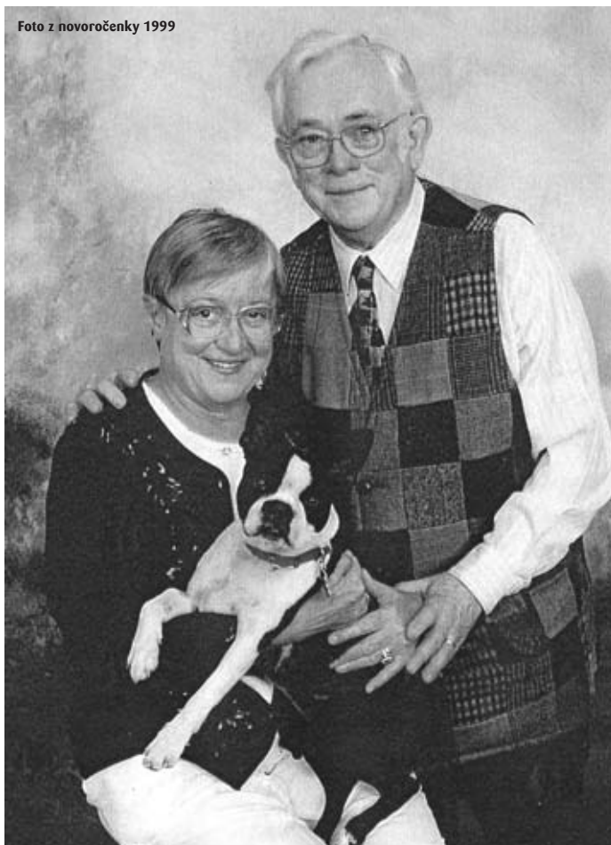
Foto z novoročenky 1999