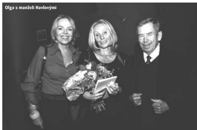
Olga s manželi Havlovými

Poprvé jsem s kamerou oslovila manželku Olgy Havlové v Míčovně Pražského hradu, když jsem v roce 1993 natáčela GEN o jeho ženě Olze. S Olžinou sekretářkou jsem se předem dohodla, že pana prezidenta upozorní na to, že se ho zeptám na jeho manželku. Po mé slabomyslné otázce: co pro vás znamená vaše žena Olga, mi příkře odpověděl: je spolehlivá. To byla sprcha. Sekretářka totiž nic nevyřídila. Druhý den jsem s Olgou natáčela na Hrádečku, Václav telefonoval své ženě, že se mi omlouvá.