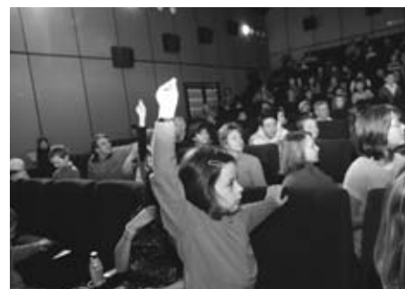
Sál byl plný nadšených dětí