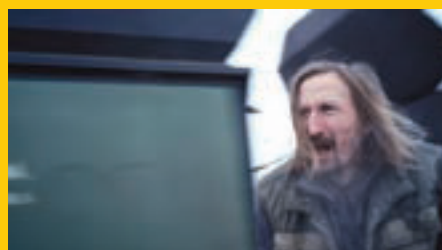
Z filmu Poupata vybraného na MFF KV do soutěže Na východ od Západu