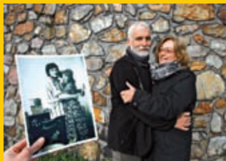
Film Heleny Třeštíkové Soukromý vesmír byl nominován do dokumentární soutěže karlovarského festivalu i Ceny Pavla Kouteckého.