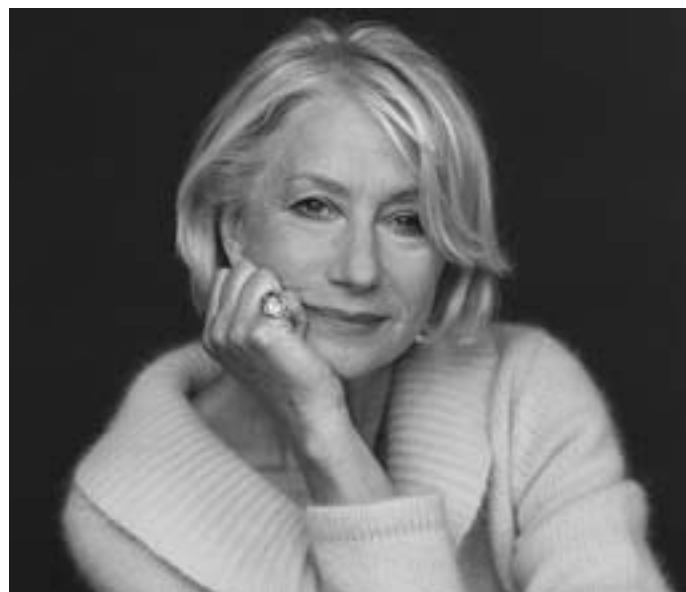
Jedním z očekávaných hvězdných hostů 47. MFF Karlovy Vary je herečka Helen Mirrenová

Letní kino se poté, kdy bylo znovu uvedeno do provozu pro filmové projekce, zařazuje mezi tradiční festivalové prostory. Také pro letošní ročník MFF se počítá s jeho začleněním do dramaturgie doprovodných akcí a možností festivalových projekcí.