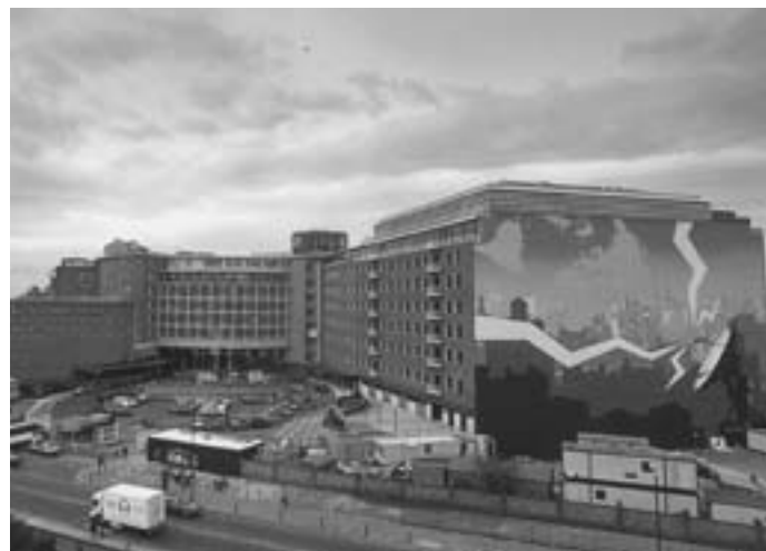
Televizní centrum ve White City v západním Londýně je dnes na prodej