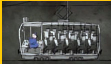
Hned několikrát bodoval na Mezinárodním festivalu animovaných filmů v Annecy snímek Michaely Pavlátové Tramvaj.