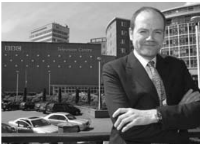
Dosud úřadující ředitel BBC Mark Thompson odejde po olympijských hrách