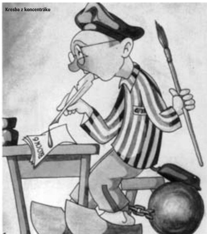
Miloš Volf: Pisal, 1944 Soukromý majetek

Miloš Volf pracoval jako pisal na bloku č. 6. V karikatuře zachytil sám sebe.