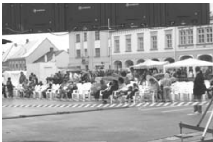
Nevadil ani déšť