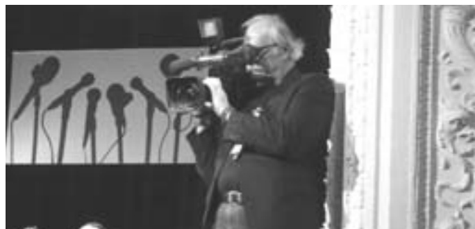
Vše se pečlivě filmovalo