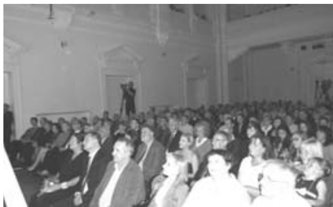
Občanská záložna praskala ve švech