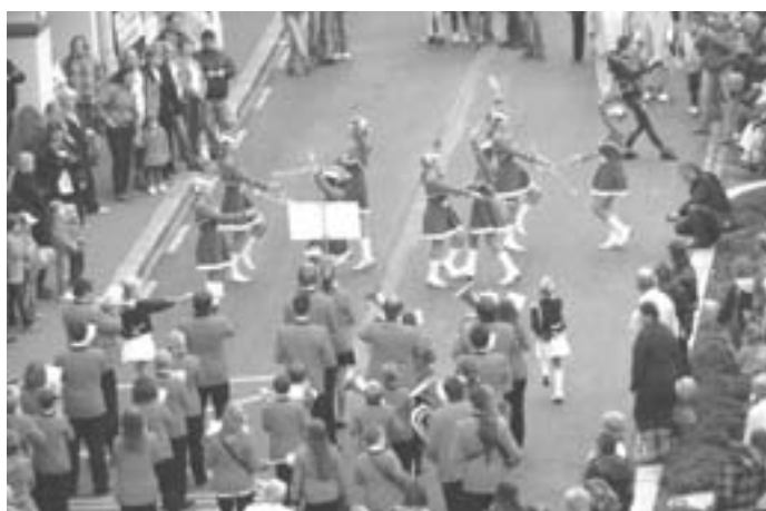
V Přelouči byla velká sláva